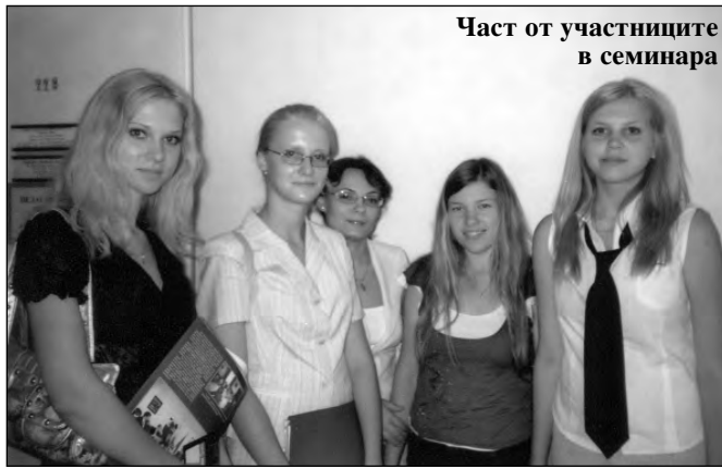
Част от участниците в семинара

В рамките на семинара бяха включени Младежка научна конференцията „Русе – Волгоград, 2006“, запознаване с Русе, езикова практика, почивка на море и др.